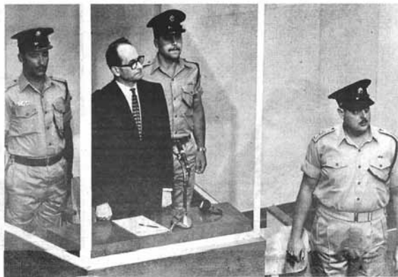
El castigo. Eichmann en la sala donde se lo juzgó, en la ciudad de Jerusalem.

A cincuenta años del juicio a Eichmann, realizado en la ciudad de Jerusalén, el seminario "busca reflexionar acerca de este juicio histórico, de las consecuencias que tuvo en la escena jurídica, así como del impacto que tuvo en la política y la cultura israelí de los años sesenta". El curso comenzará el próximo martes, a las 19, en el auditorio del Museo (Córdoba 2019), y se desarrollará a lo largo de cuatro reuniones, en la última de las cuales se pro-