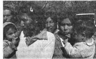
Las mujeres, protagonistas.

Este encuentro se desarrollará desde hoy en la sede de Insgenar (Tucumán 3950) y participarán del mismo mujeres provenientes de pueblos originarios como el qom, mocoví, diaguita, kolla, mbya guaraní, de las provincias de Santa Fe, Chaco, Formosa, Tucumán, Jujuy y Misiones.