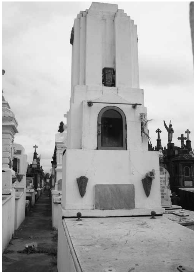
Tumba en Cementerio La Piedad. ¿Prefiguración del Monumento a la Bandera?