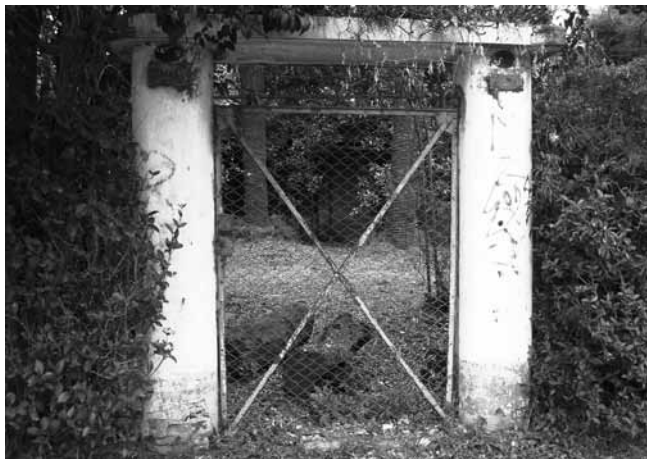
«Villa Natividad» Medrano y Superí