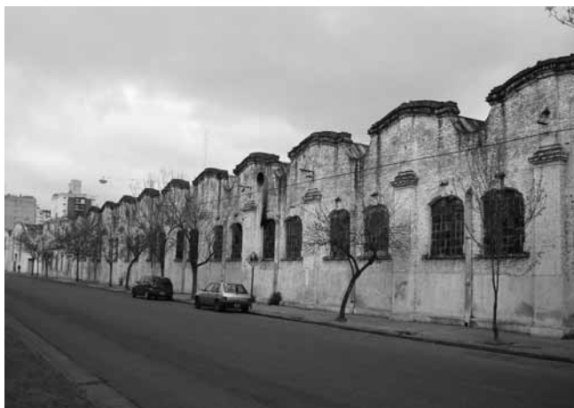
Galpones municipales: fachada sobre la calle Montevideo entre Suipacha y Richieri